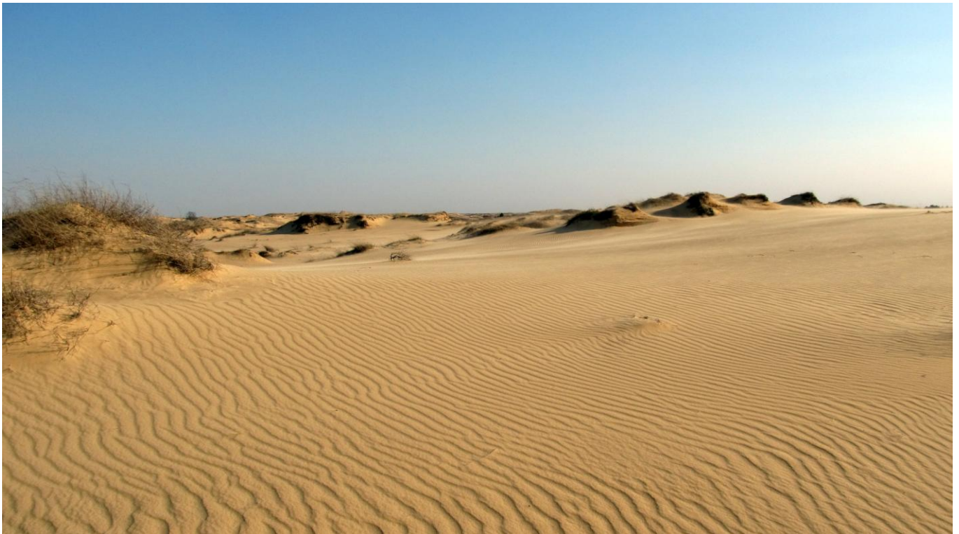
Піщана пустеля Національний природний парк «Олешківські піски»