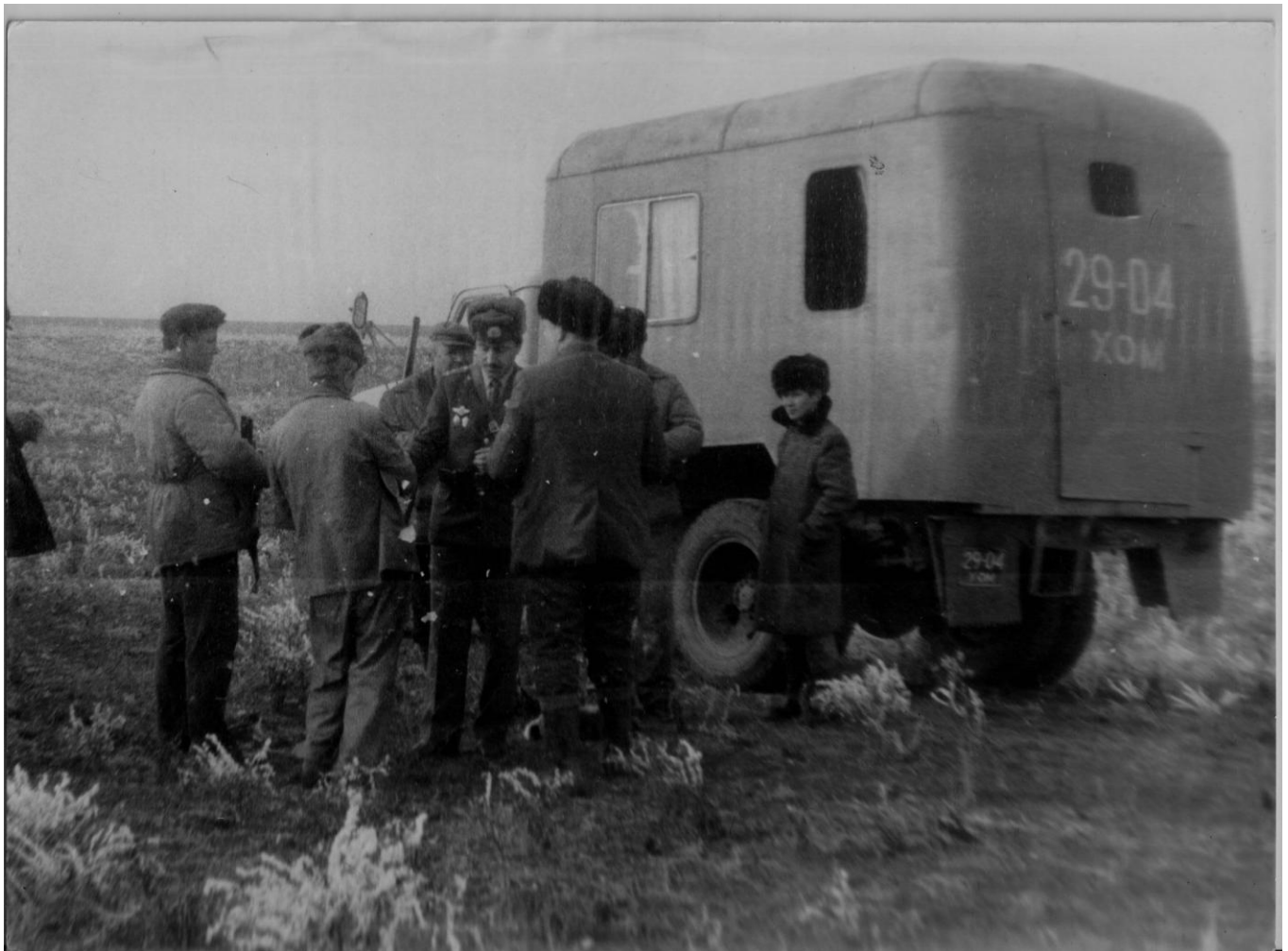
Рейд-перевірка дотримання природоохоронного законодавства у 1989 році