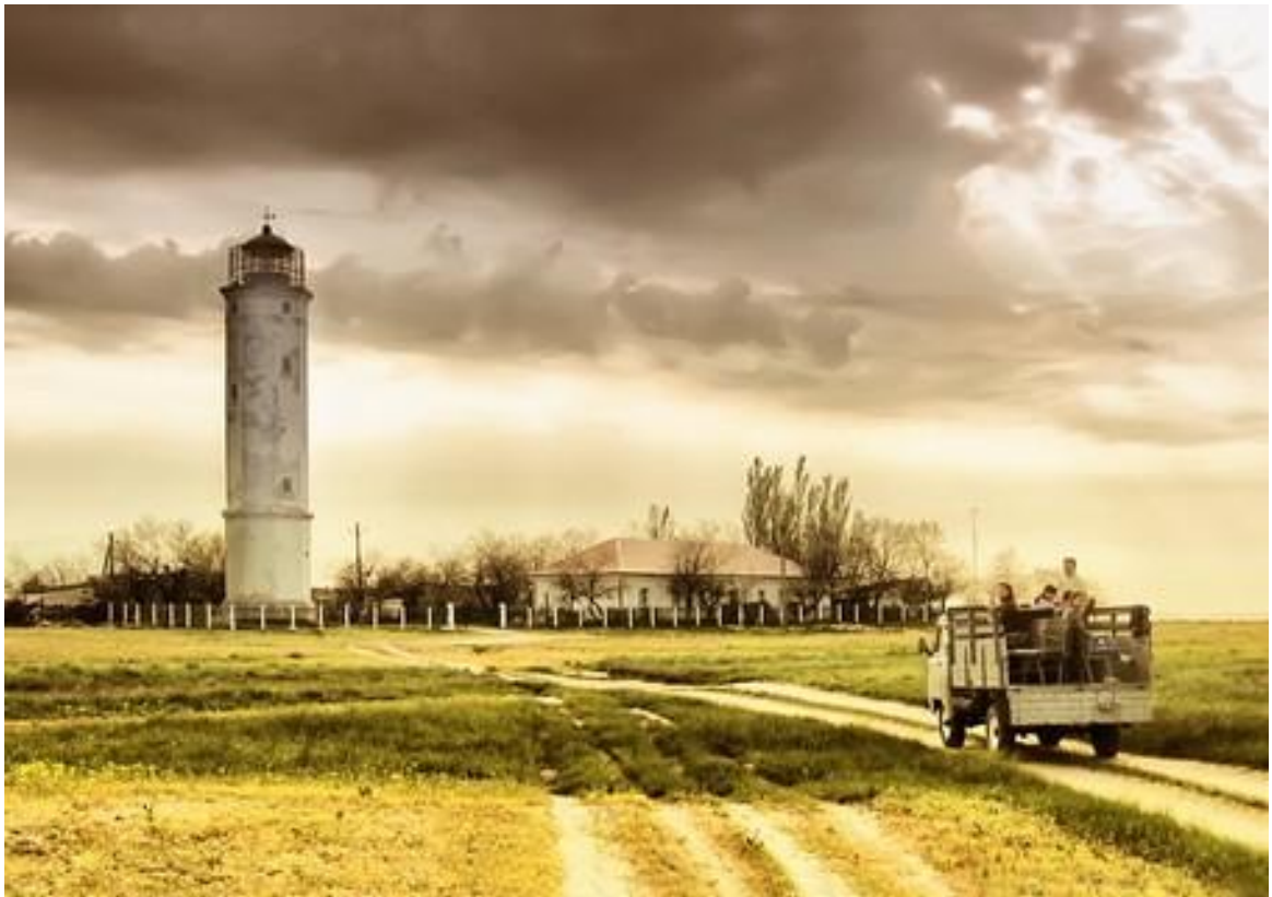
Маяк на острові Джарилгач Національний природний парк «Джарилгацький»