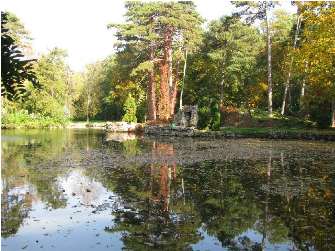
Дендропарк «Асканія-Нова» Біосферний заповідник «Асканія-Нова» ім. Ф.Е. Фальц-Фейна