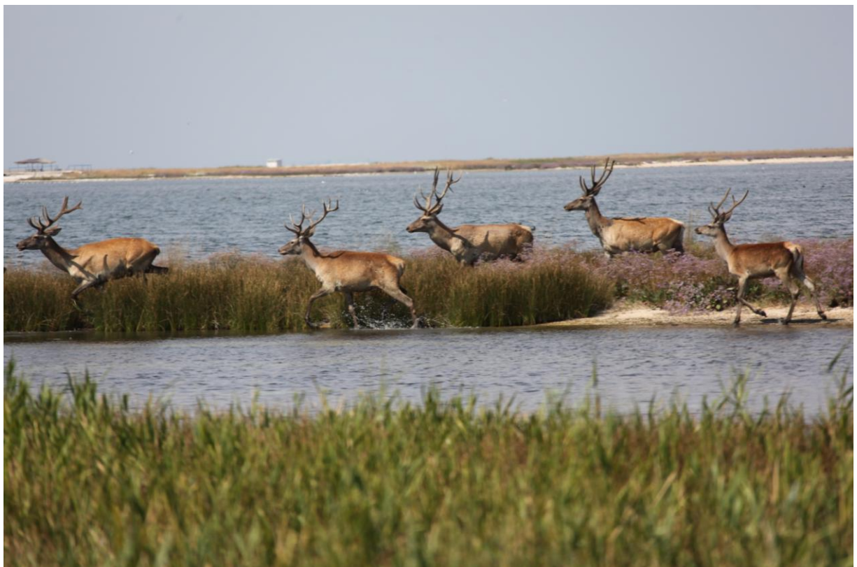
Прісне озеро острова Джарилгач Національний природний парк «Джарилгацький»