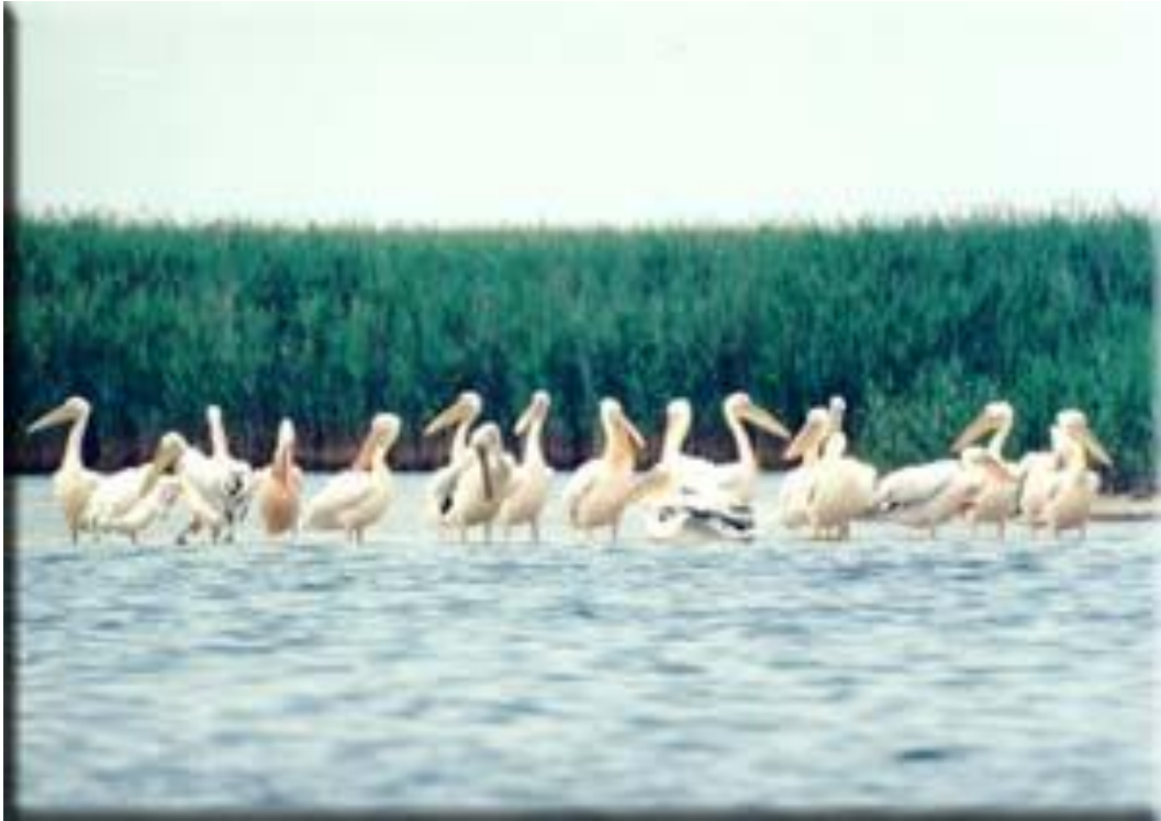
Оселення пелікану рожевого Чорноморський біосферний заповідник