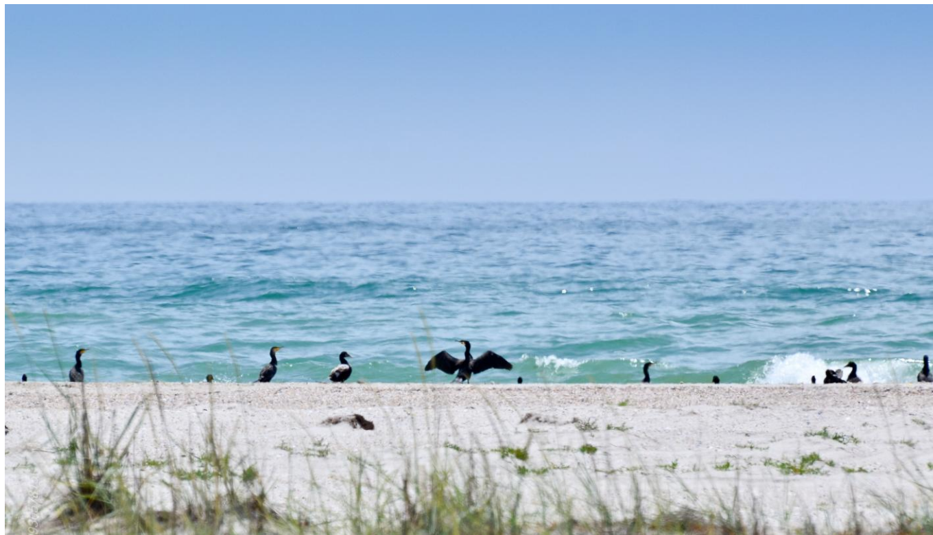
Водоплавні птахи острова Бірючий Азово-Сиваський національний природний парк

Завдяки реформам розпочалася масштабна робота по вивезенню з території країни не придатних до використання хімічних засобів рослин.