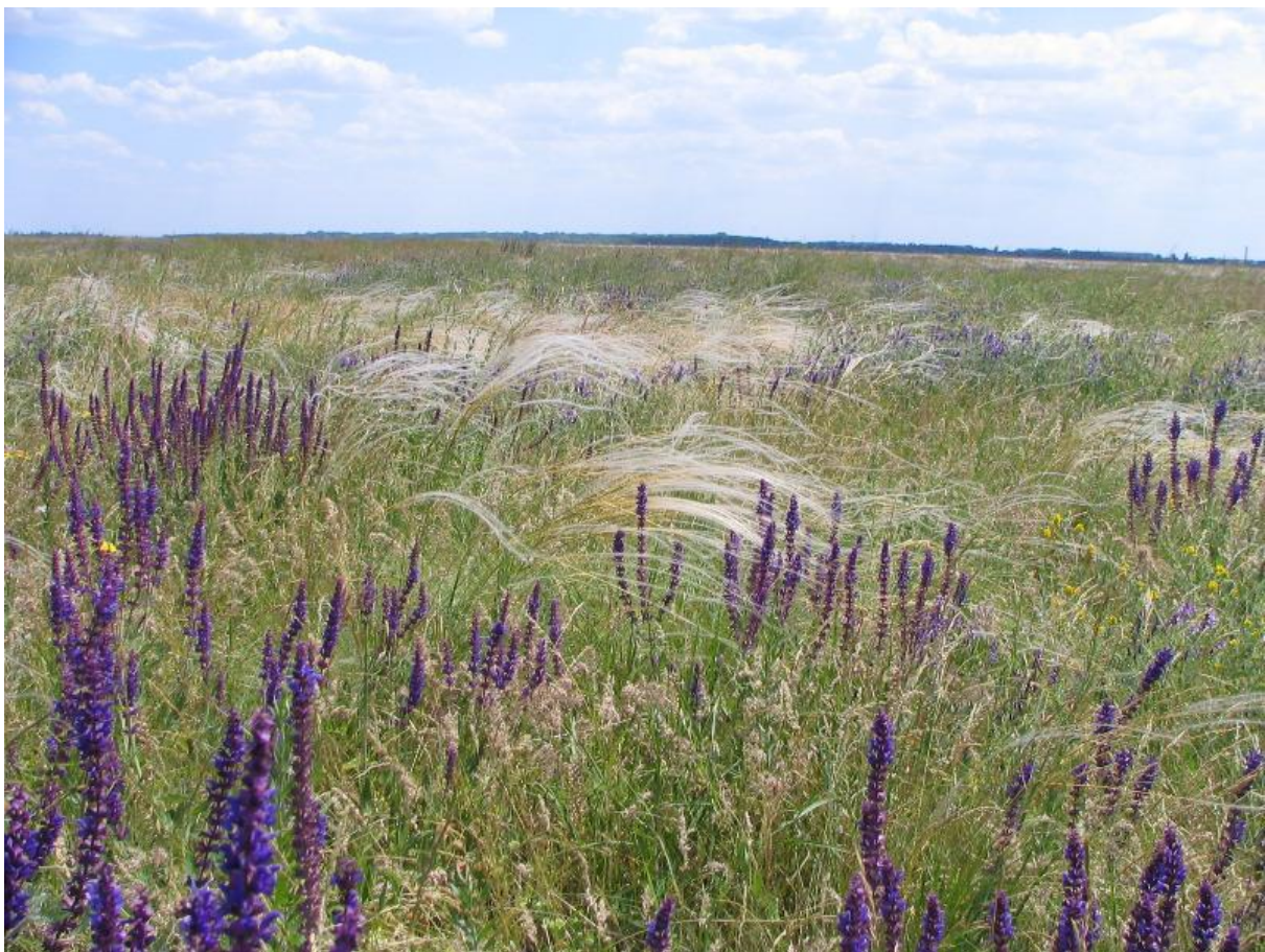
Типчакowo-ковиловий степ в Асканія-Нова Біосферний заповідник «Асканія-Нова» ім. Ф.Е. Фальц-Фейна