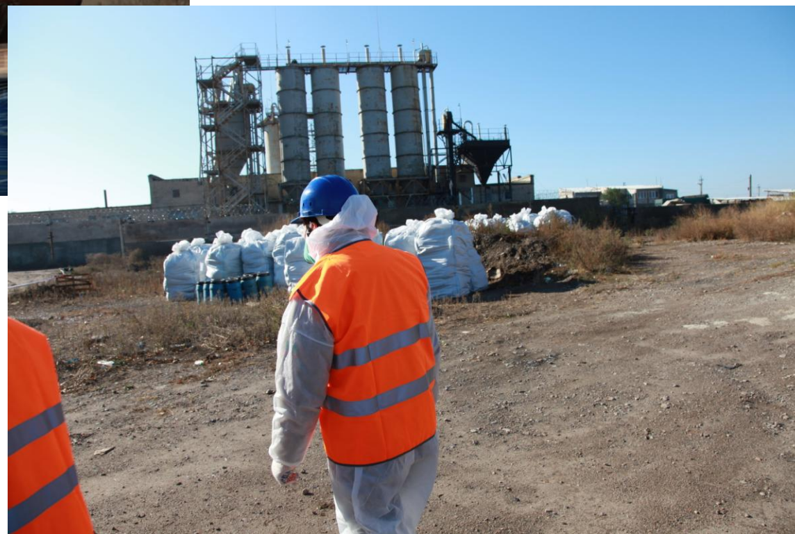
Проведення робіт по вивезенню не придатних та заборонених до використання хімічних засобів захисту рослин на Херсонщині